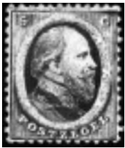
De eerste geperforeerde zegel van Nederland: De 2e emissie van 1864

1995 zal te boek staan als het eerste jaar waarin PTT Post zelfklevende zegels heeft uitgebracht. Nadat in 1864 de tweede emissie van Nederland werd voorzien van een perforatie, zijn postzegels in ons