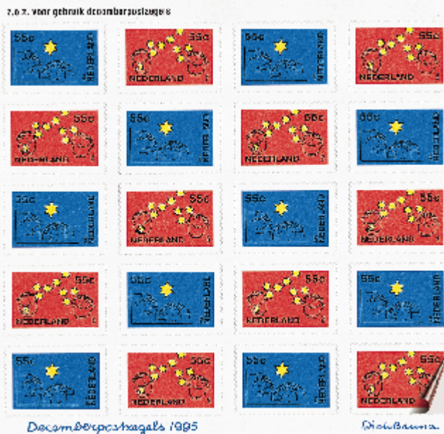
Het velletje zelfklevende decemberpostzegels. Handig voor gebruikers, maar voor verzamelaars?

De decemberpostzegels 1995 zijn geproduceerd met een zelfklevende gom. Het kan zijn dat aan de randen van de uit de velletjes geknipte decemberpostzegels gom naar buiten komt, zodat de rand rondom de postzegel iets plakkerig aanvoelt.