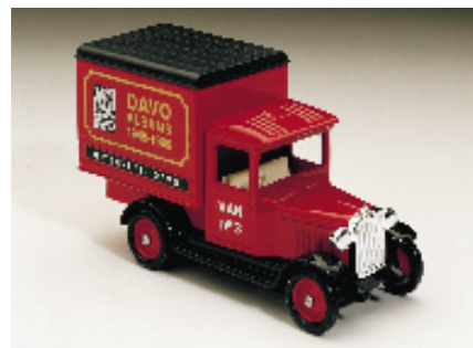
DAVO VAN n° 3. Onderdeel van het Jubileumpakket. Ook los verkrijgbaar (f 25,00)

liefhebbers tevreden te stellen. VAN n° 3 is nu "van de band gerold" en maakt deel uit van dit Jubileumpakket. Moeten wij van de DAVO VAN een jaarlijks terugkerend item maken? Zijn er liefhebbers die zo een serie, het liefst compleet natuurlijk, van de jaarlijkse DAVO Van willen opbouwen.