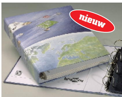
De nieuwe KOSMOS band Universe

Een nieuwe band voor het DAVO KOSMOS-systeem. Naast de bestaande éénkleurige (blauwe) banden is er een nieuw, levendig model ontworpen dat uitblinkt in veelkleurigheid en door de fraaie